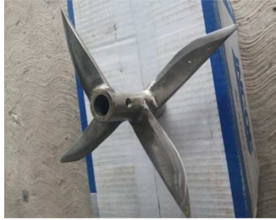
Gambar 4. Mata Pisau