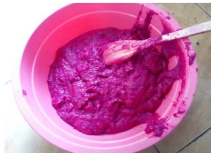
Gambar 7. Puree kulit buah naga

Pada saat proses pembuatan puree, kulit buah naga dimasukkan kedalam tabung secara bertahap hal ini disebabkan karena kulit buah naga memiliki serat yang kuat sehingga