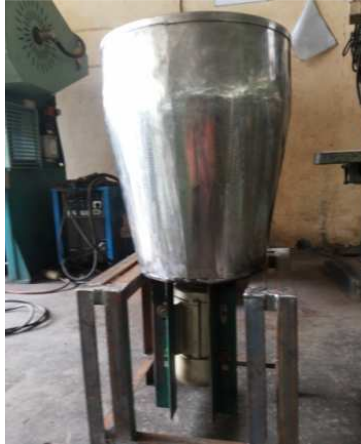
Gambar 2. Alat pembubur kulit buah naga