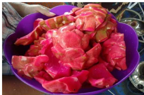
Gambar 5. Pembersihan kulit buah naga

Pada saat uji coba alat dalam pembuatan puree kulit buah naga, berat buah naga yang dipergunakan sebesar 40 kg. Berat bersih kulit buah naga yang didapat setelah isi buah naganya dikeluarkan sebesar 7 kg. Sedangkan rendemen kulit buah naga setelah dijadikan puree kulit buah naga adalah tetap beratnya 7 kg atau 100%, hal ini disebabkan pada saat pembuatan puree tidak ada penambahan air seperti pada gambar 6.