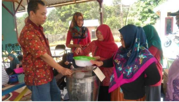
Gambar 6. Pembuatan puree kulit buah naga

Proses pembuburan kulit buah naga terdiri dari dua antara lain proses pembuburan dengan menggunakan air dan proses pembuburan tanpa menggunakan air. Proses pembuburan kulit buah naga dengan menggunakan air lebih mudah, hal ini disebabkan bubur kulit buah naga lebih encer sehingga gelombang dalam tabung yang ditimbulkan oleh mata pisau akan lebih ringan. Akan tetapi pembuatan puree kulit buah naga dengan menggunakan air akan mengubah warna bubur kulit buah naga menjadi kecoklatan. Sedangkan proses pembuburan kulit buah naga tanpa menggunakan air agak lambat hal ini disebabkan bubur kulit buah naga lebih kental sehingga putaran mata pisau sedikit lebih berat. Warna puree kulit buah naga yang dihasilkan tidak berubah, seperti pada gambar 7.