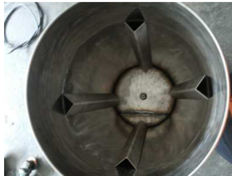
Gambar 3. Tabung pembubur kulit buah naga

Tabung pembubur kulit buah naga terbuat dari bahan plat stainless steel dengan ketebalan 2 mm. Pada bagian dinding dalam tabung dipasang bantalan, dimana fungsi dari bantalan ini untuk menimbulkan gelombang pada saat proses pembuburan sehingga bahan yang dibuburkan berputar dan hasil yang dibuburkan sama-sama halus. Tabung pembubur kulit buah naga seperti pada gambar 3