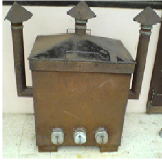
Gambar 2. Tungku Pengarangan